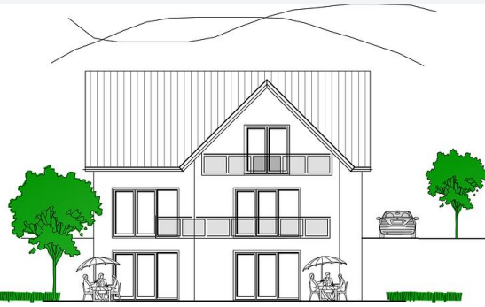
Süd - Ansicht M 1 : 100