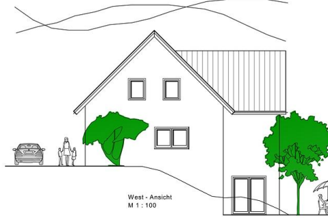
West - Ansicht M 1 : 100