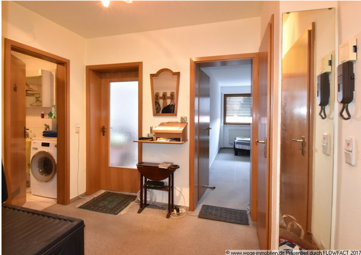
© www.woge-immobilien.de Präsentiert durch FLOWFACT 2017