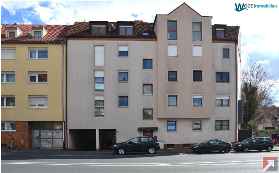
© www.woge-immobilien.de Präsentiert durch FlowFact 2017