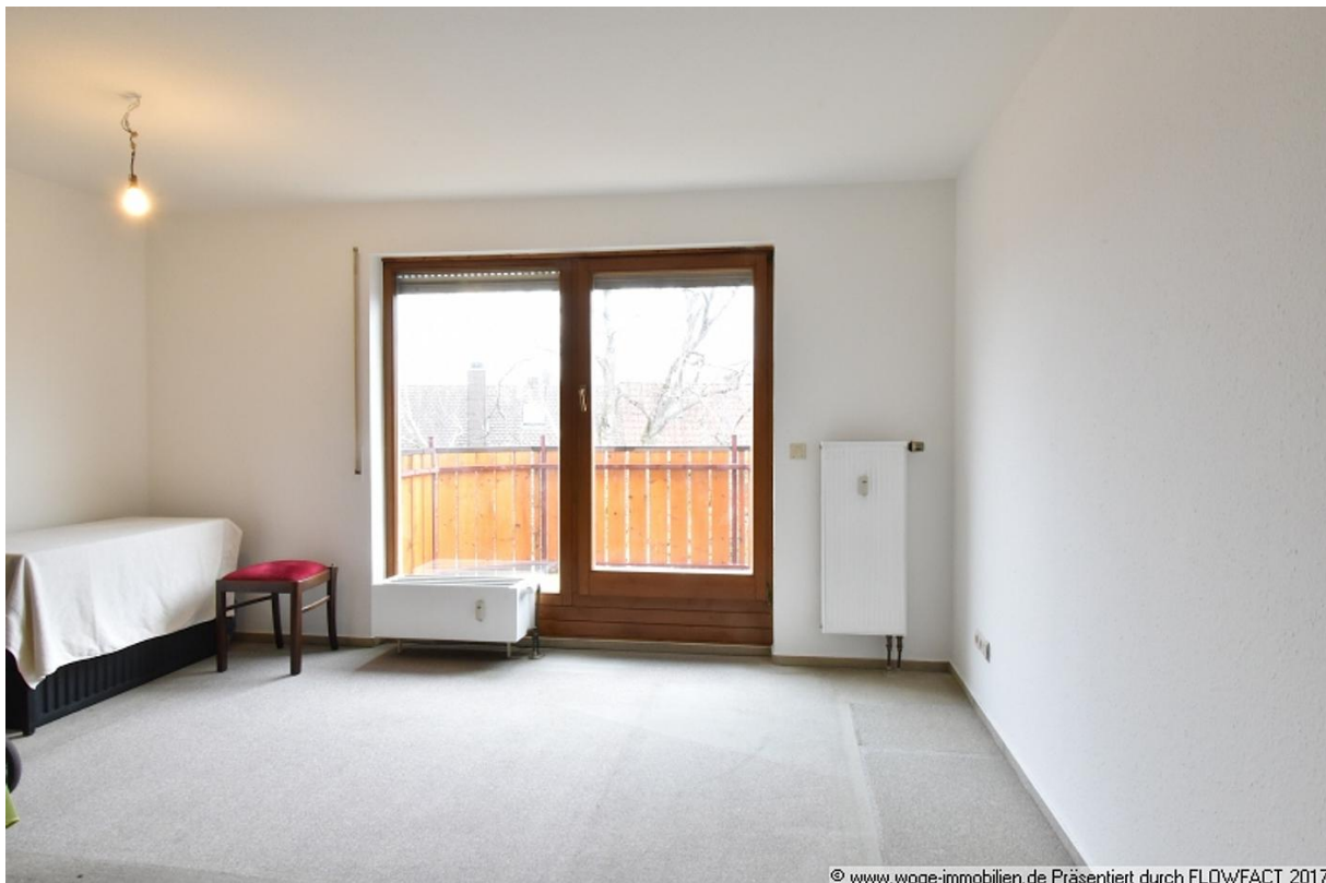
Präsentiert durch FLOWFACT 2017