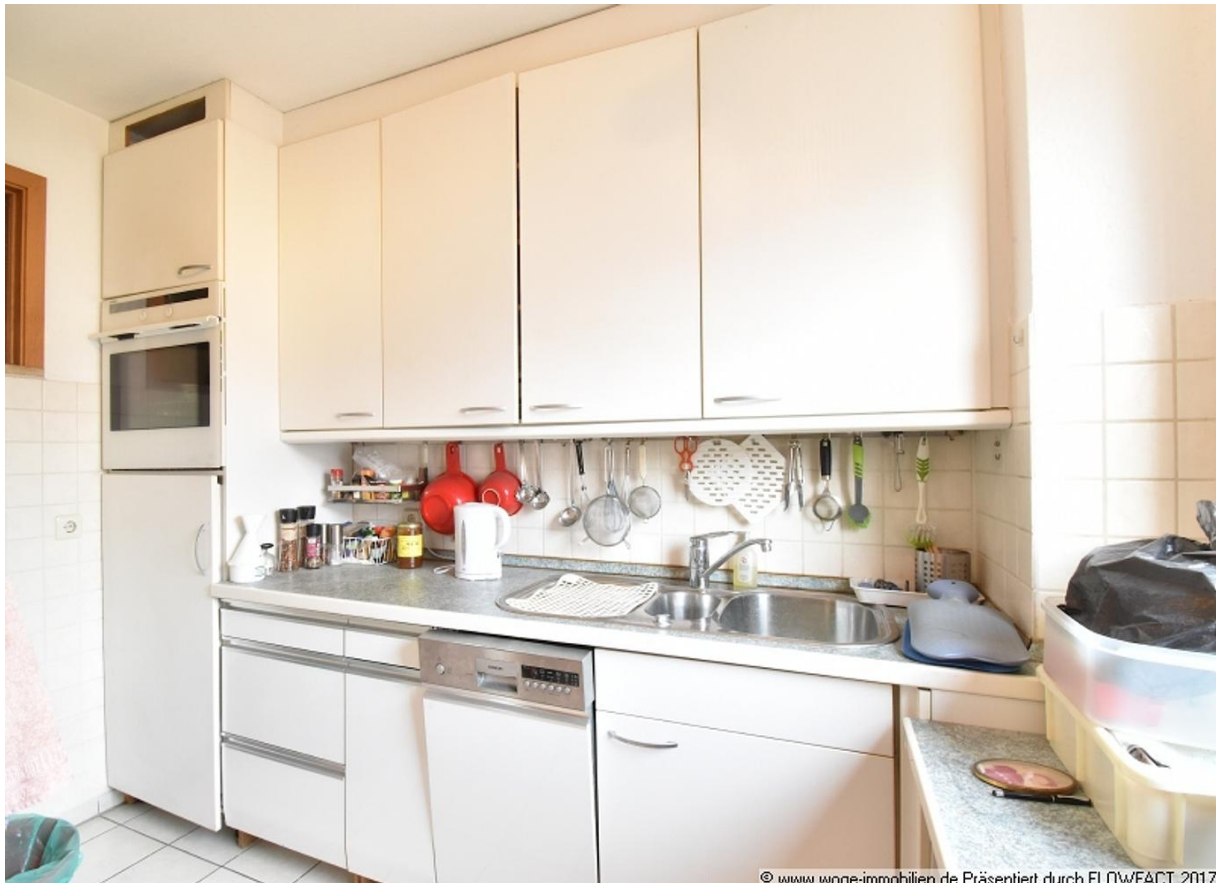
© www.woge-immobilien.de Präsentiert durch FLOWFACT 2017