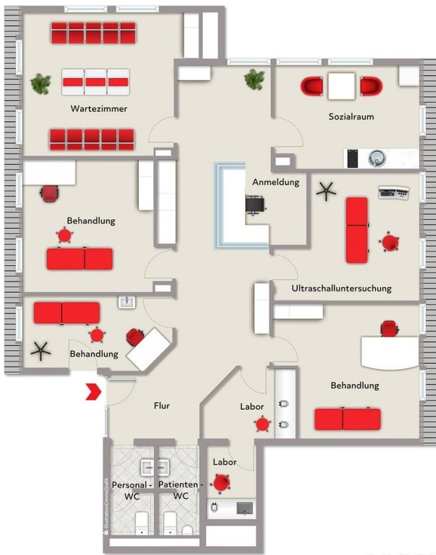
Exposiplan, nicht maßstäblich