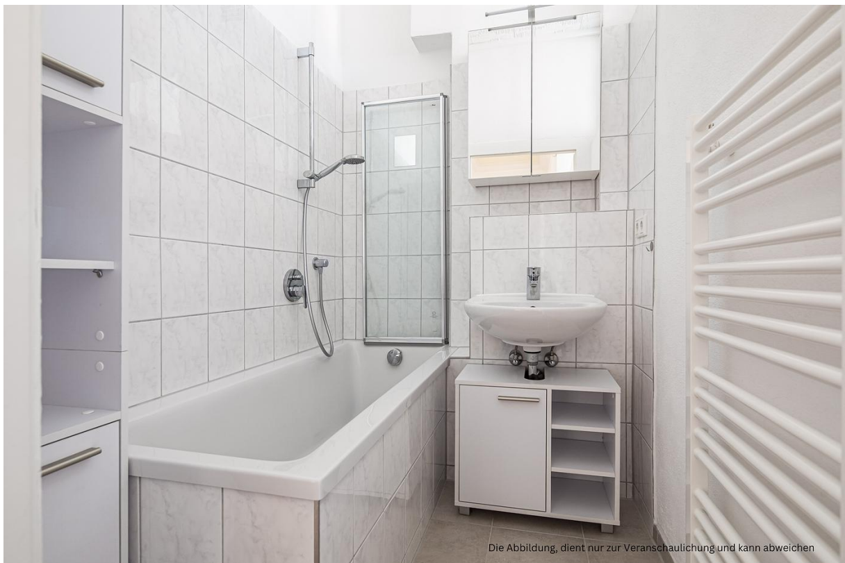
Die Abbildung, dient nur zur Veranschaulichung und kann abweichen