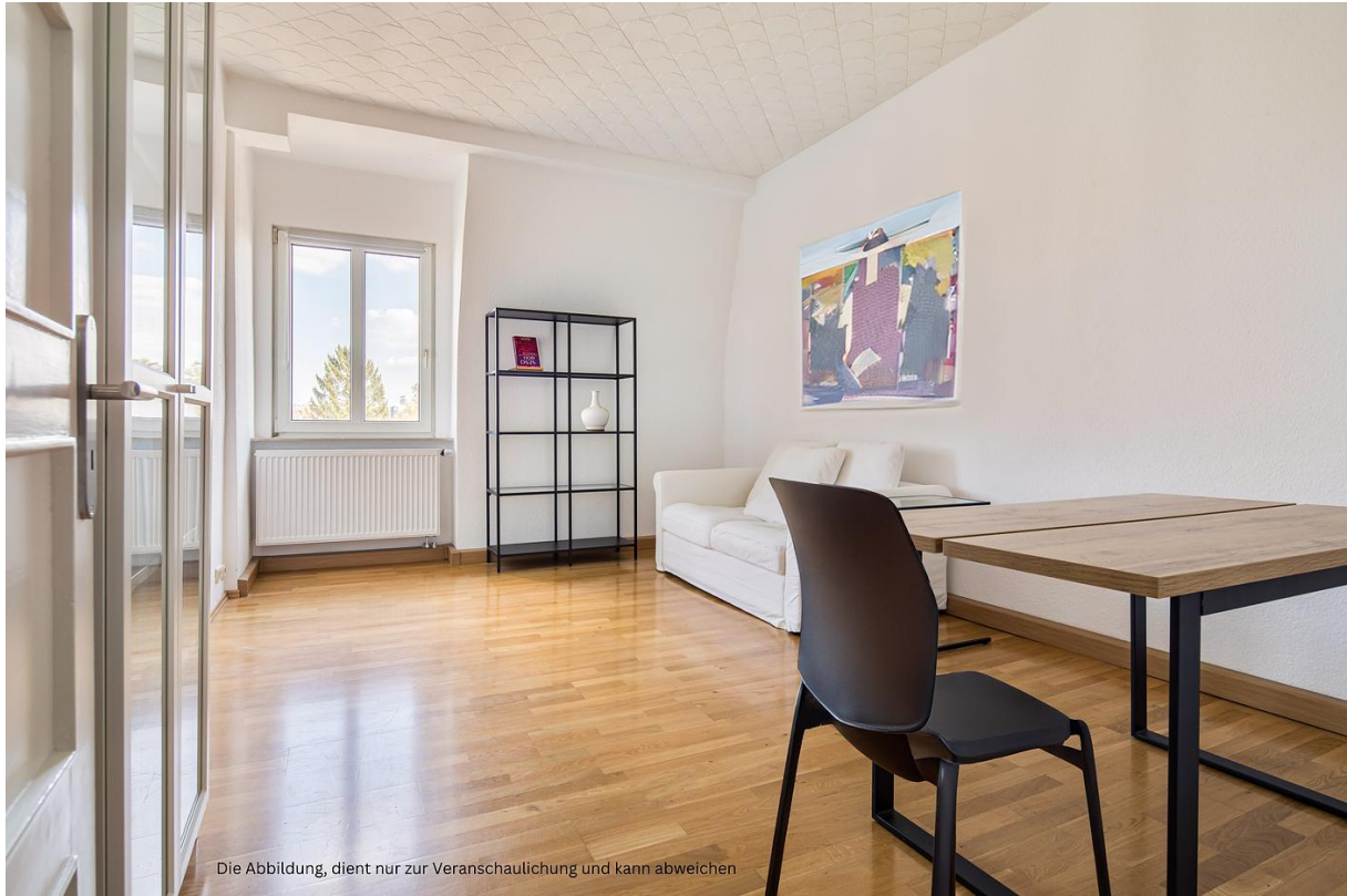
Die Abbildung, dient nur zur Veranschaulichung und kann abweichen