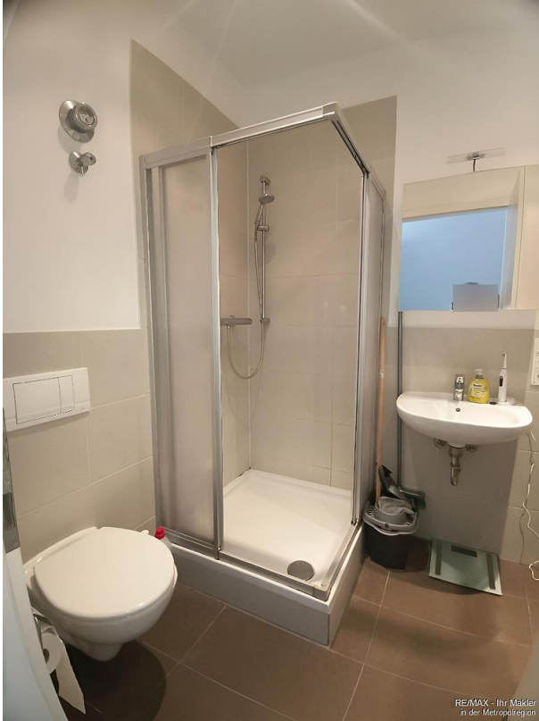
RE/MAX - Ihr Makler in der Metropolregion