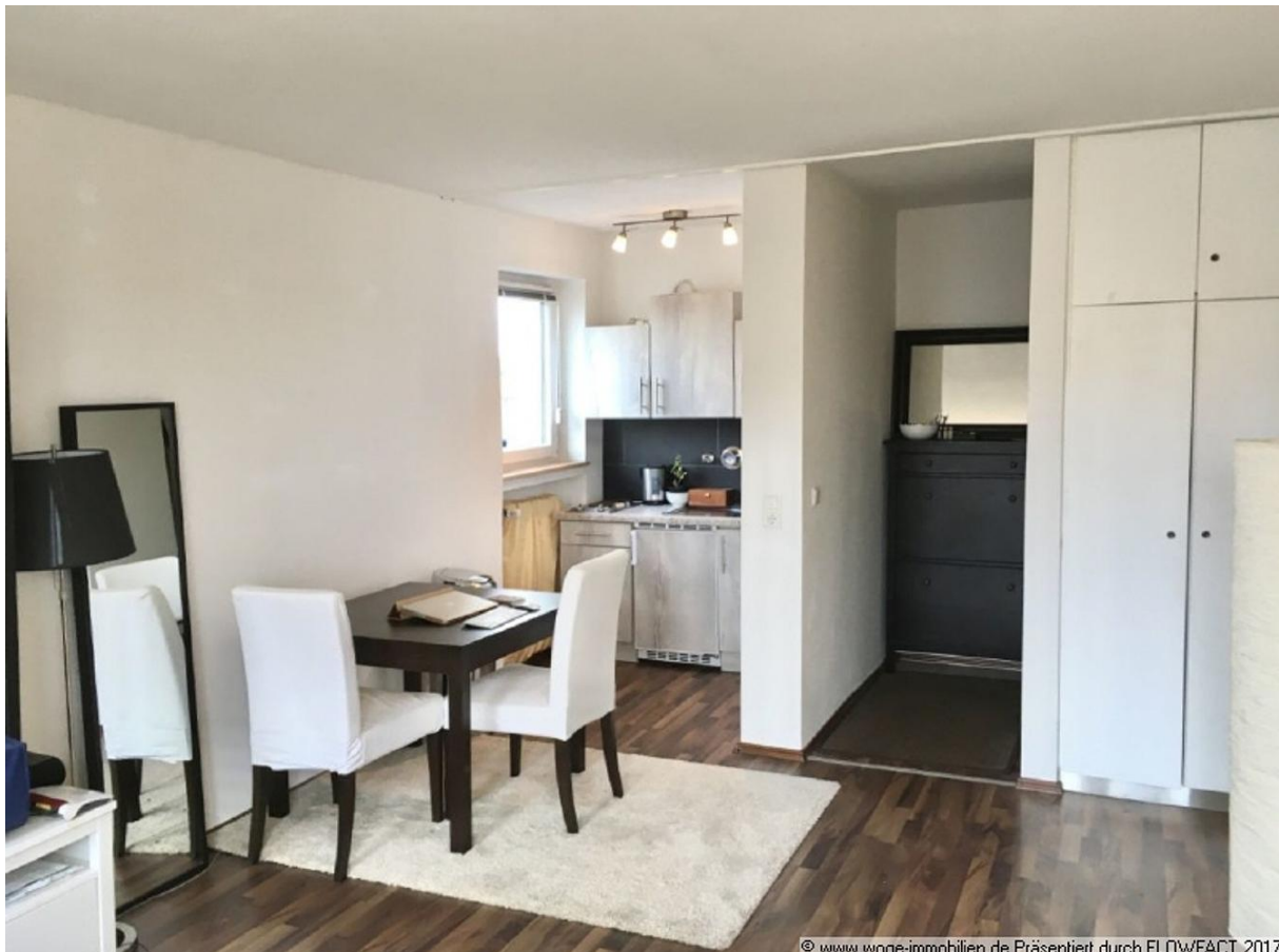
© www.woge-immobilien.de Präsentiert durch FLOWFACT 2017