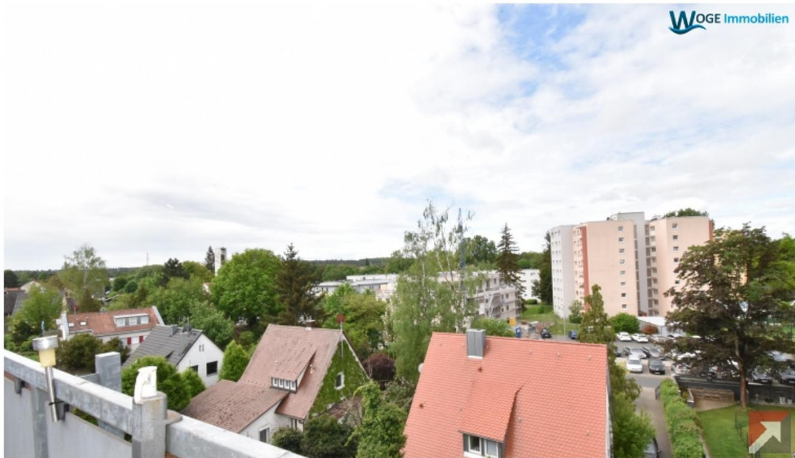
© www.woge-immobilien.de Präsentiert durch FlowFact 2017