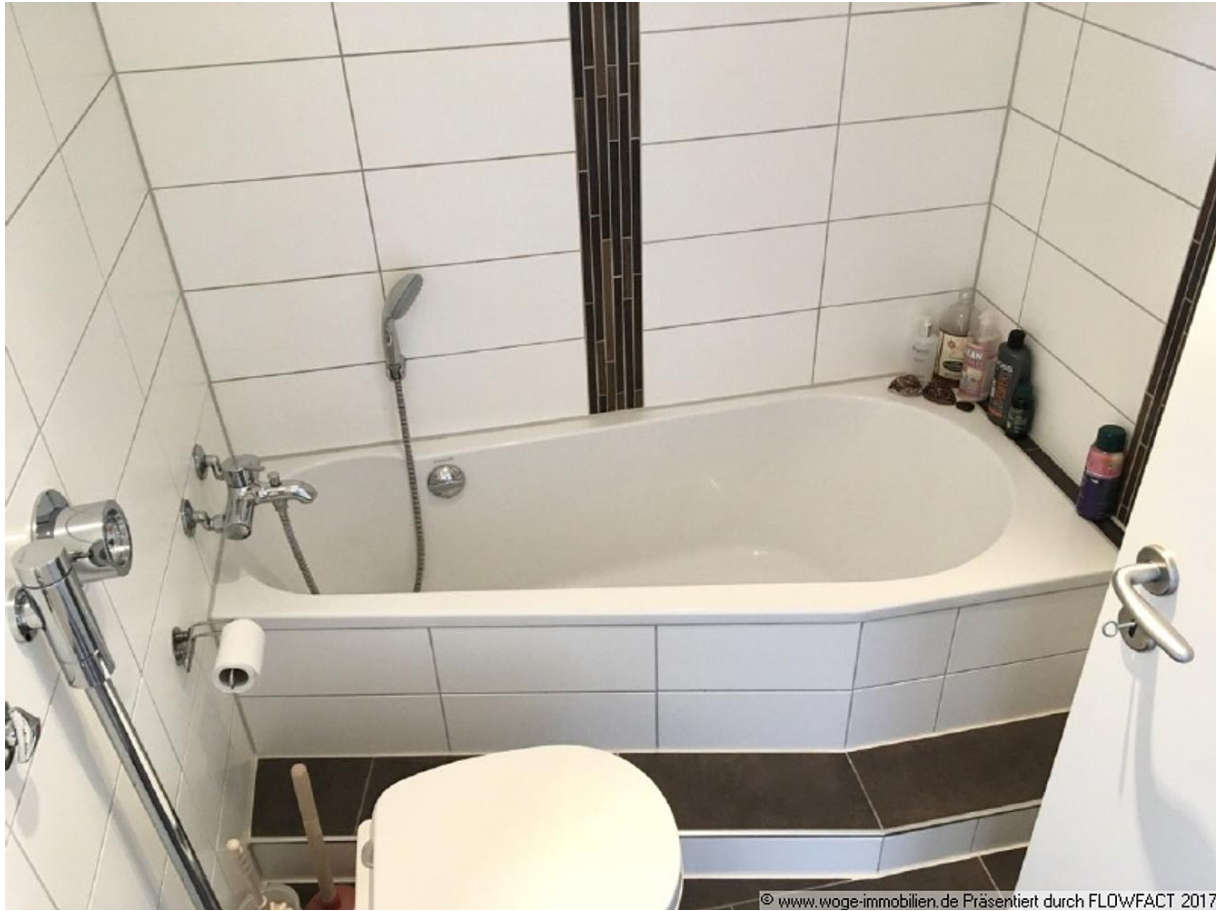
Präsentiert durch FLOWFACT 2017